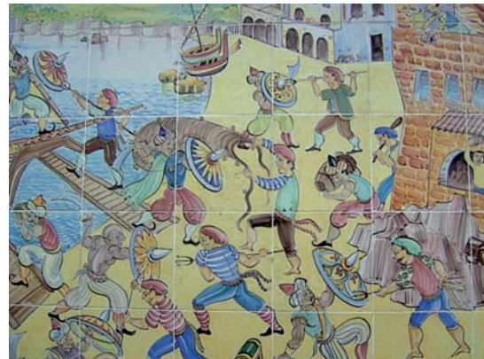
La battaglia tra corsari saraceni e marinai e pescatori del borgo marinaro: un classico della ceramica vietnese.

Per tutti loro, la mole possente della torre di guardia era la sicurezza, la difesa, non soltanto, dei pochi ed umili beni che possedevano, ma dei principi